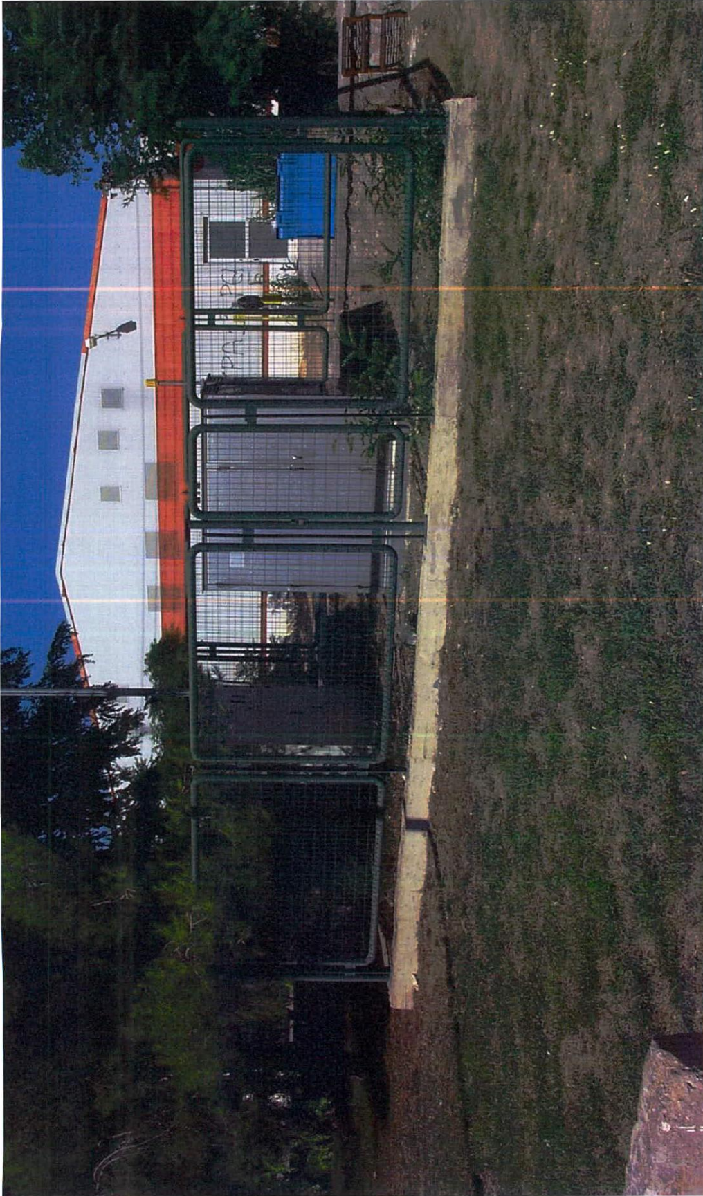
ΦΩΤΟΓΡΑΦΙΑ ΕΓΚΑΤΕΣΤΗΜΕΝΟΥ ΣΤΑΘΜΟΥ ΔΙΑΝΟΜΗΣ 19/4